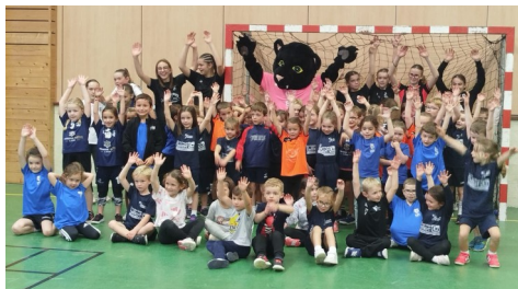
L'ensemble des équipes présentes lors du plateau « premiers pas » organisé à Bodilis en octobre.