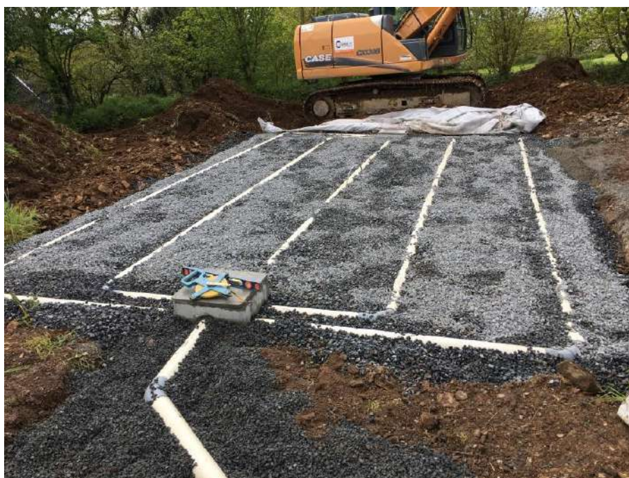
Exemple de dispositif de Traitement par filtre à sable vertical non drainé