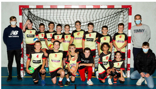
Les garçons de moins de 13 ans.

Ce mois-ci nous souhaitons faire un focus sur le groupe des moins de 13 ans gars. En effet, par manque d'effectif et en préparation des futures saisons les garçons sont cette année en entente avec ceux de Landivisiau. Il y a 2 équipes, l'une engagée en brassages de niveau haut et l'autre en brassage de niveau bas.